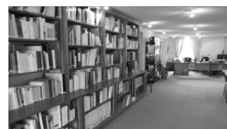
Bibliothèque du Centre avec les dernières intégrations au fonds.

2007 est donc une année charnière après une année 2006 quelque peu perturbée. 2008 sera, sans nul doute, tout aussi passionnante.