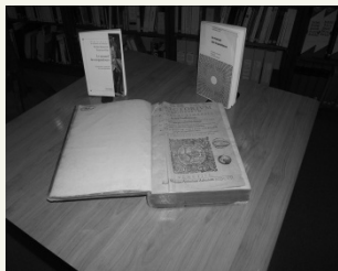
Trois éditions du Manuel des Inquisiteurs.

L'organisation des Journées Européennes du Patrimoine est une bonne opportunité pour montrer au grand public des ouvrages qu'il n'a pas l'occasion de voir le reste de l'année. En effet ces ouvrages sont conservés dans une vitrine fermée et ne sont consultables que sur demande. En général ces utilisateurs sont des chercheurs ou des universitaires. C'est donc le 15 septembre dernier, que quelques pièces majeures de notre fonds ancien ont été présentées dont le Directorium inquisitorum de F. Nicolai Eymerici (Rome,